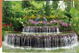
Jardín botánico de Singapur, 1859