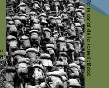
"Gold Mine, Serra Pelada", 1986