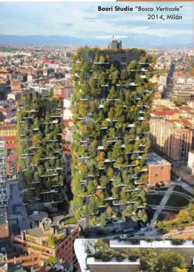
Boeri Studio "Bosco Verticale" 2014, Milán