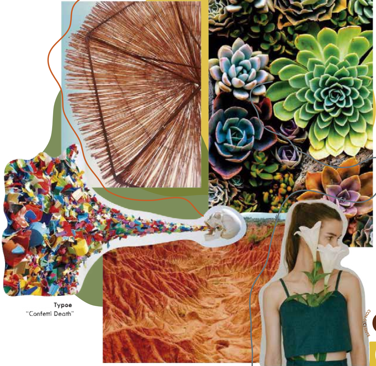
Typee "Confetti Death"

Fluido Desigual Orgánico Geométrico Colorido