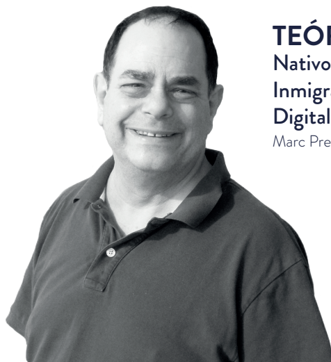
TEÓRICO Nativos e Inmigrantes Digitales Marc Prensky